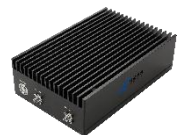
Available 220V System Benchtop Amplifier